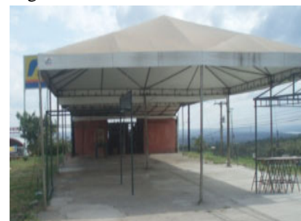
O atual e o futuro Empório do Lago Oeste

Os atuais feirantes do Empório, devidamente informados pela direção da Associação das condições para sua operacionalização, inclusive os custos estimados com segurança, energia e gerenciamento, foram, unanimemente, favoráveis ao empreendimento.