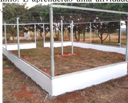
Seja um "Amigo do Cerrado", ajudando o nosso viveiro!