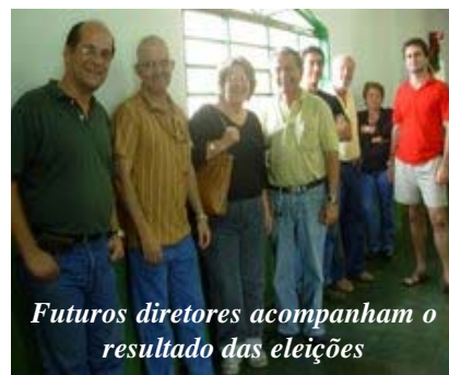
Futuros diretores acompanham o resultado das eleições

Sem festas, sem foguetes ou qualquer coisa do gênero, já que há muito trabalho a fazer, muito interesse político em jogo e pouco tempo para comemorar, tomou posse, no início de janeiro, a nova diretoria da Associação.