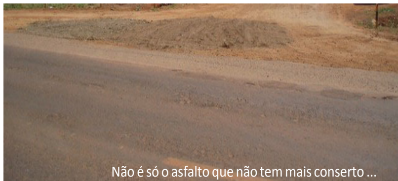
Não é só o asfalto que não tem mais conserto ... o acostamento também está intransitável!

Se depender da nossa torcida e de nosso empenho junto a autoridades e políticos, as obras começam ainda este ano... desde que as chuvas também não atrapalhem.