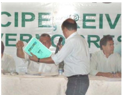
Secretário de Educação promete construção de Escola para 2008