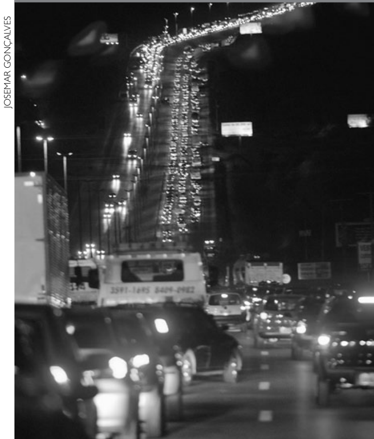
■ FILA IMENSA SE FORMOU NA PISTA CONTRÁRIA A DA BATIDA

O consumo de qualquer quantidade de bebida alcoólica por condutores está proibido, desde o último dia 19, quando entrou em vigor a Lei Seca. Antes da nova legislação, o motorista podia ingerir até 6 decigramas de álcool por litro de sangue, o que equivale a dois copos de cerveja, sem sofrer os rigores da lei.